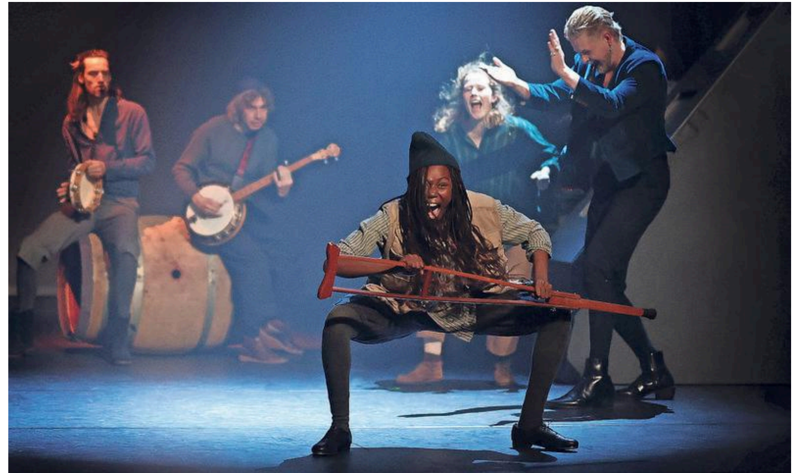
Moment uit 'De scheepsjongens van Bontekoe'.

En dus maakte De Vries een bewerking waarin het verhaal weliswaar op de voet en met veel respect voor het originele verhaal gevolgd wordt, maar waarin de acteurs op sommige momenten uit hun rol stappen en zichzelf en hun publiek vragen stellen. Over de VOC als geldmachine bijvoorbeeld. En over de manier waarop er door de Nederlandse scheepsluier tegen de inwoners van het eiland wordt