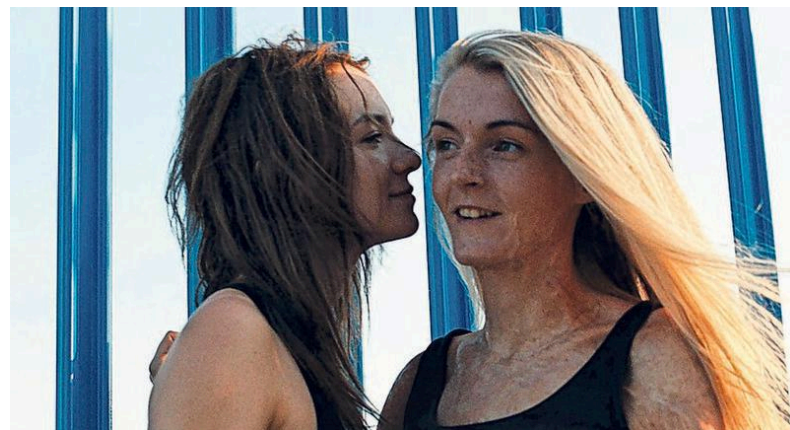
Moment uit 'Silver haze'.