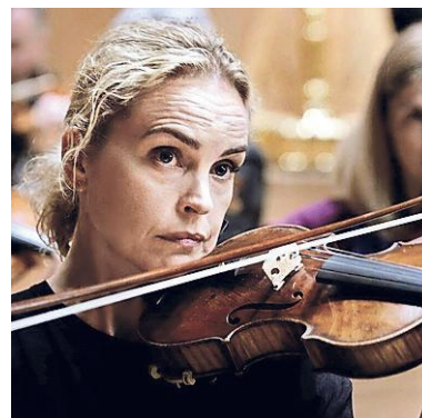
Cate Blanchett in 'Tár'.