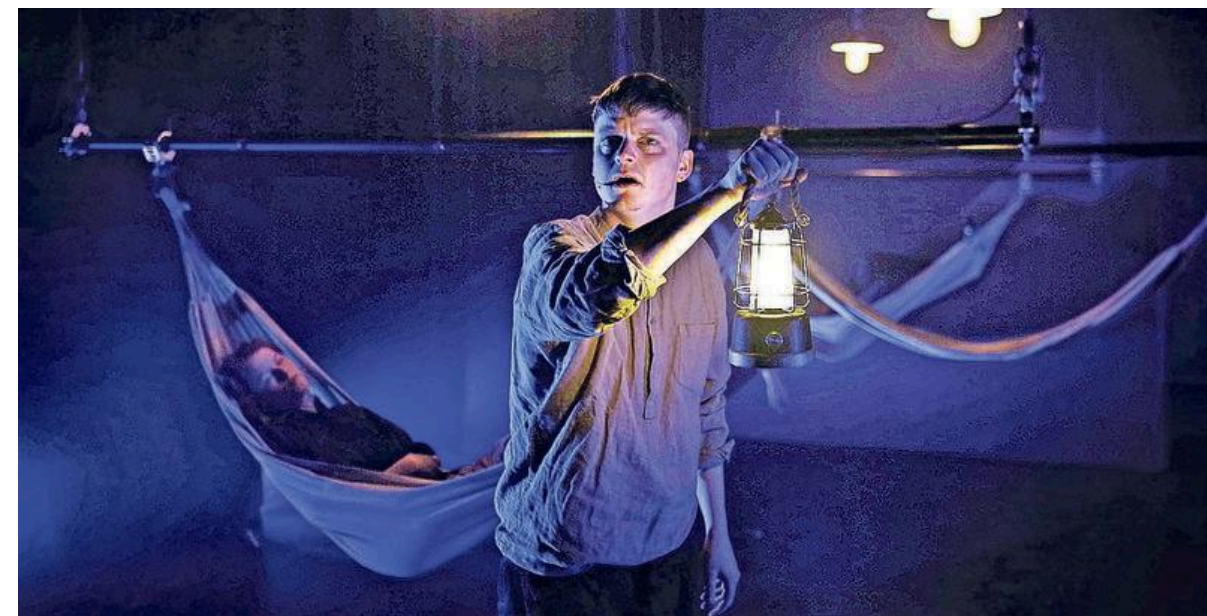
Aan boord van de Nieuw Hoorn.

Drie dagen voor de première in Zwolle is het stuk nog volledig in opbouw. De eerste doorloop heeft inmiddels plaatsgevonden en daarbij bleek dat het allemaal toch wat compacter en sneller moest. Er zijn stukken uit de tekst gehaald of ingekort en overgangen moeten daardoor wat anders worden. Daarom houden de zes jonge acteurs eerst een leesrepetitie. In een ijs-